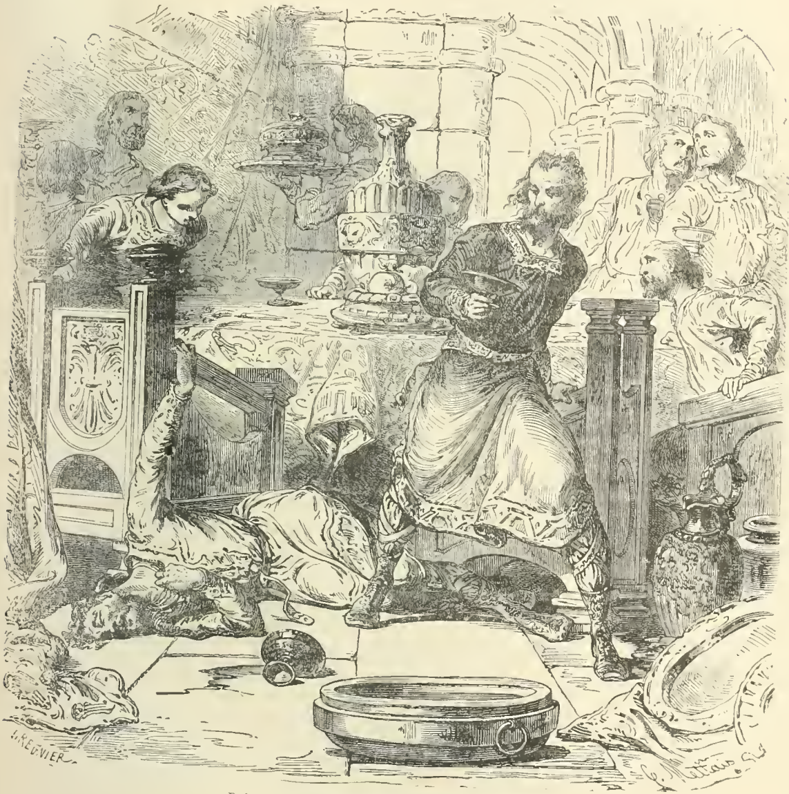
Robert le Diable empoisonne son frère Richard

s'éleva par ses exploits militaires aux plus hautes dignités. Après une grande victoire remportée sur les Norvégiens, il obtint l'office d'Eorl, ou chef politique de l'ancien royaume de West-sax, réduit alors à l'état de province. Beaucoup d'autres Anglais servirent avec